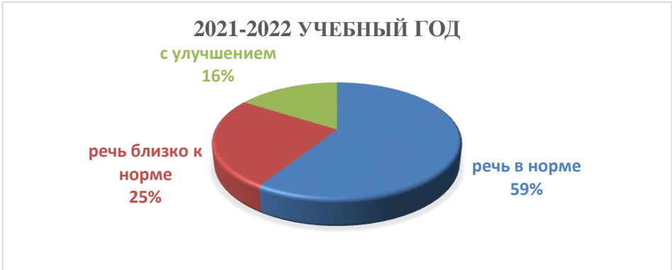
Сводная диаграмма речевого развития детей логопункта за межаттестационный период